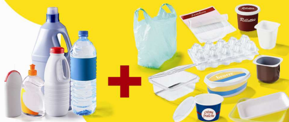
Tous les emballages en plastique sans exception.

Pas besoin de les laver : il suffit de bien les vider.