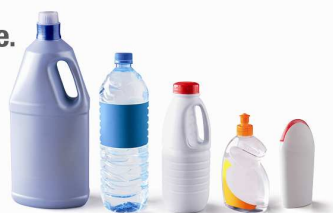
Bouteilles et flacons en plastique.

Vous déposiez dans votre sac/bac de tri tous les emballages métalliques (canettes, boîtes de conserve...), les emballages en carton et les bouteilles et flacons en plastique .